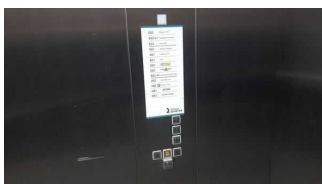
Bedienelemente / Leitsystem