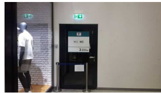
Öffentliches WC für Menschen mit Behinderung in der Einkaufsgalerie, UG