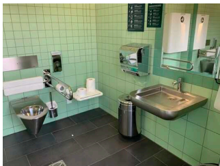
Öffentliches WC für Menschen mit Behinderung im Hauptbahnhof, Gleis 1