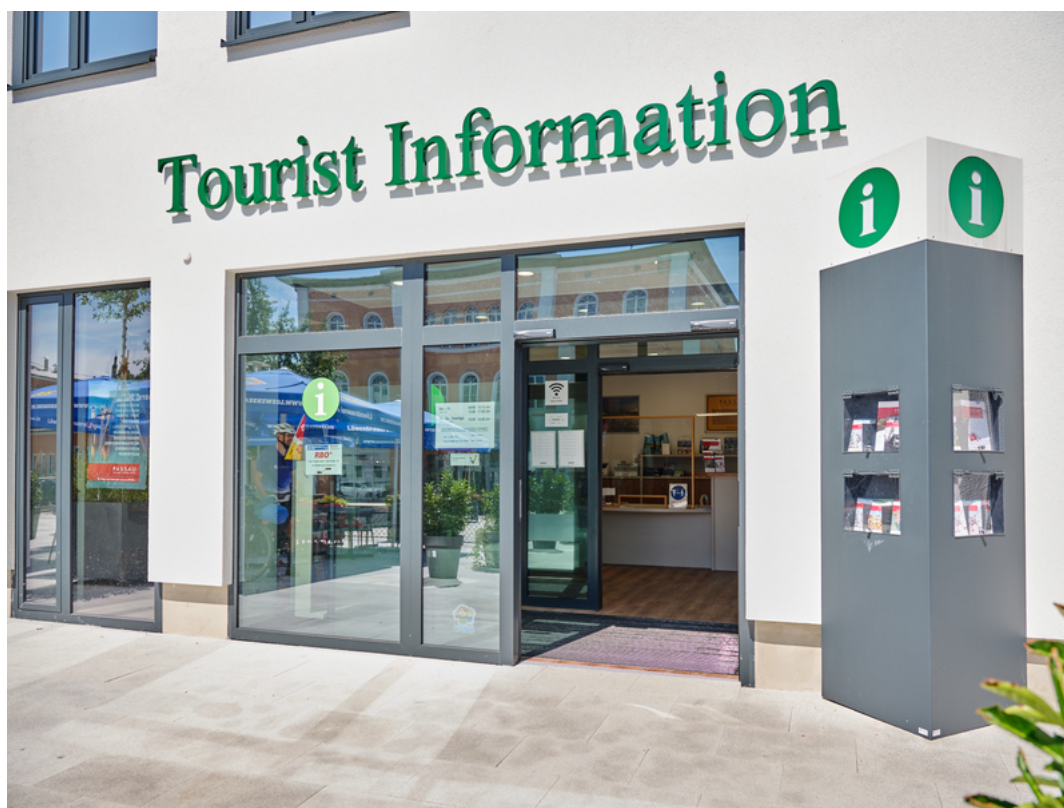
Tourist-Information am Hauptbahnhof Passau | pedagrafie