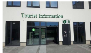
Eingang Tourist Information am Hauptbahnhof Passau