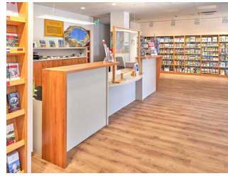
Tourist-Information am Hauptbahnhof Passau