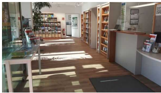
Kundenraum mit Schalter