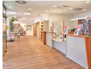
Tourist-Information am Hauptbahnhof Passau