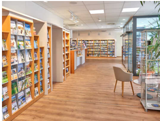
Tourist-Information am Hauptbahnhof Passau