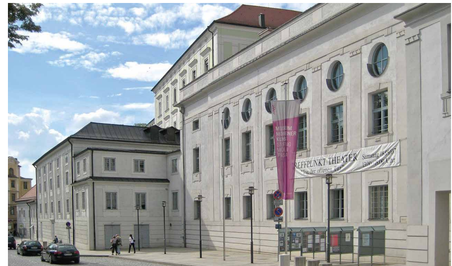
CC BY-SA 3.0/de, Aconcagua, Stadttheater Passau, https://de.wikipedia.org/wiki/Stadtheater_Passau#/media/Datei:Stadtheater_Passau_2.jpg